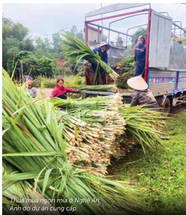
Thu mua ngọn mía ở Nghệ An.

Như lời một cán bộ chăn nuôi địa phương giải thích: 'Nếu không có thương lái, nhiều hộ sản xuất nhỏ lẻ sẽ gặp khó khăn trong việc bán sản phẩm và tìm kiếm nguồn thức ăn thô xanh chất lượng. Họ là chất keo gắn kết toàn chuỗi lại với nhau.'