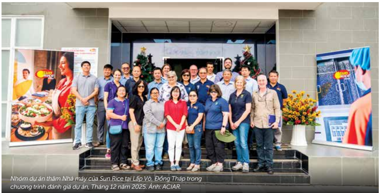
Nhóm dự án thăm Nhà máy của Sun Rice tại Lấp Vò, Đồng Tháp trong chương trình đánh giá dự án, Tháng 12 năm 2025.