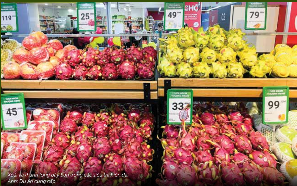
Xoài và thanh long bày bán trong các siêu thị hiện đại.