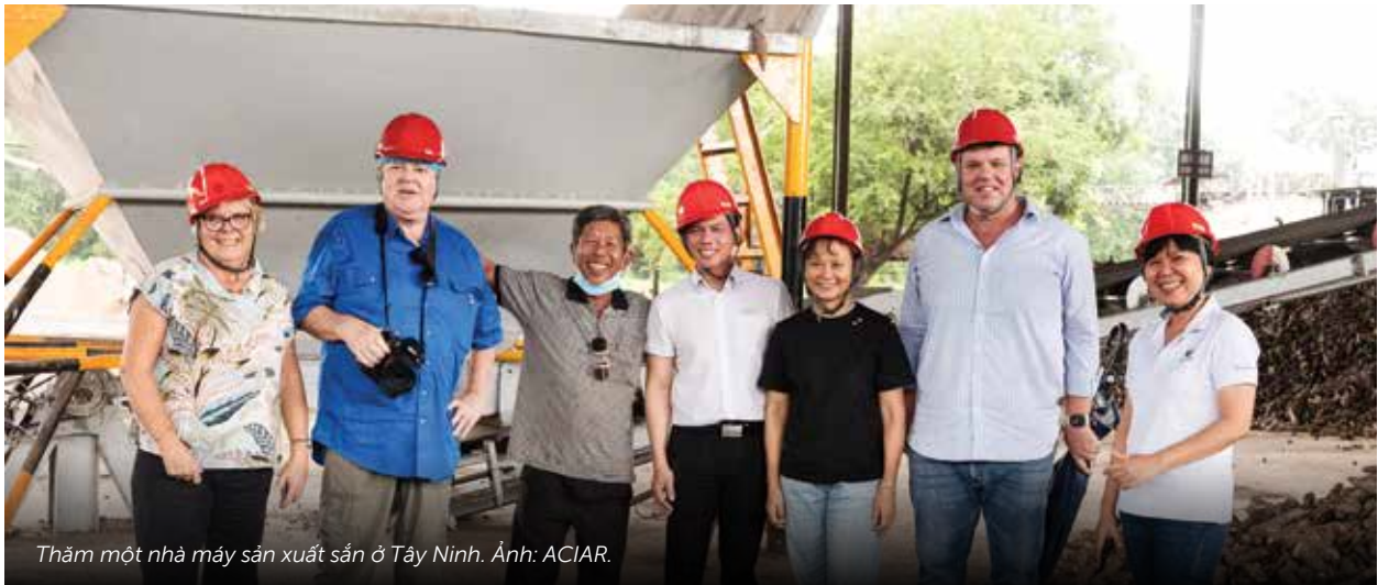
Thăm một nhà máy sản xuất sắn ở Tây Ninh.

để tìm hiểu dự án do ACIAR tài trợ nhằm tạo ra chuỗi giá trị ở Tây Nguyên, mang về lợi nhuận tốt hơn cho nông dân. Câu chuyện của Chris đã hé lộ những ‘nỗi đau’ của ngành cà phê khi chứng kiến diện tích vườn cà phê sụt giảm trong những năm qua. Để hỗ trợ nông dân, nhóm nghiên cứu đã thử nghiệm các biện pháp quản lý đất và dịch bệnh và hỗ trợ một số hợp tác xã địa phương sản xuất cà phê Robusta chất lượng cao để có lợi nhuận tốt hơn.