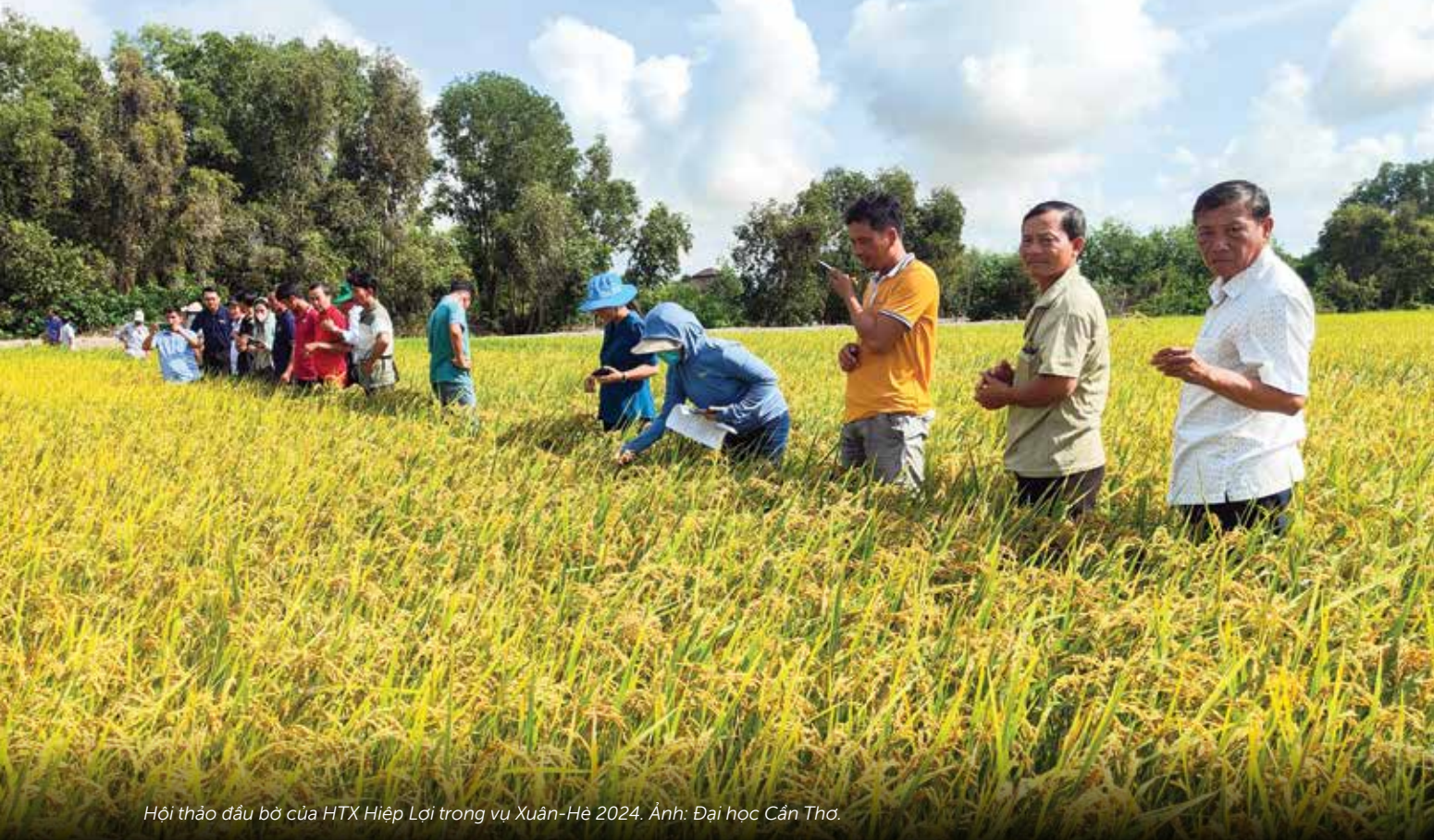
Hội thảo đầu bờ của HTX Hiệp Lợi trong vụ Xuân-Hè 2024.