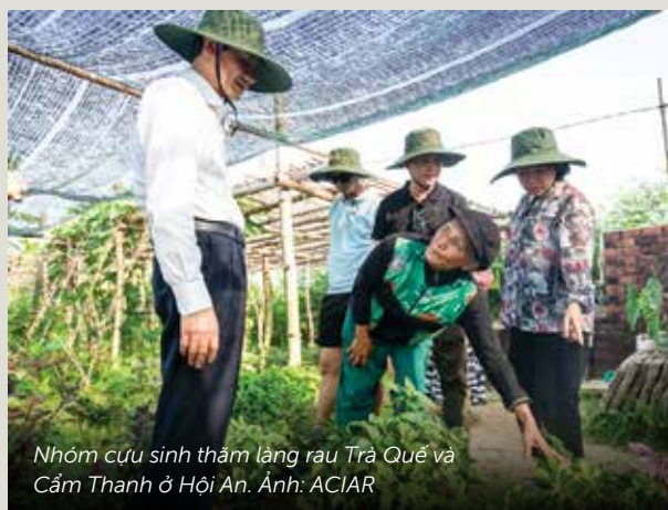
Nhóm cựu sinh thăm làng rau Trà Quế và Cẩm Thanh ở Hội An.

nông nghiệp với du lịch sinh thái. Sau chuyến đi, các cựu sinh càng khẳng định nhu cầu xây dựng kỹ năng cho nông dân trong thời đại số, bao gồm phát triển thương hiệu, thương mại điện tử và năng lực quản lý hợp tác xã, đặc biệt cho nhóm nông dân trẻ và lớn tuổi.