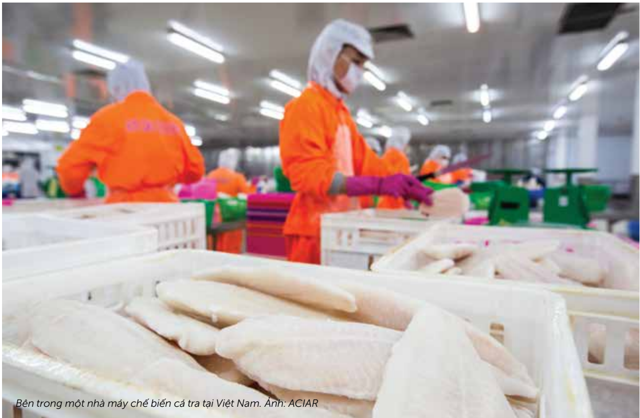
Bên trong một nhà máy chế biến cá tra tại Việt Nam.