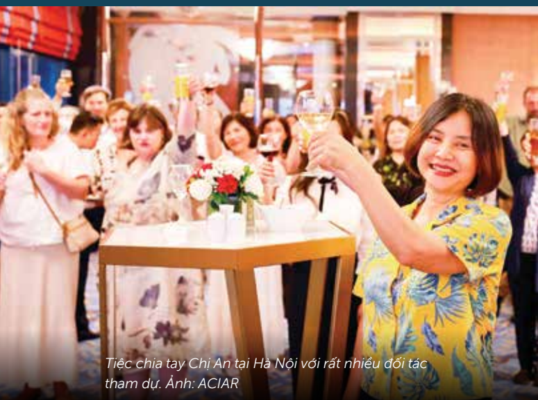
Tiệc chia tay Chị An tại Hà Nội với rất nhiều đối tác tham dự.