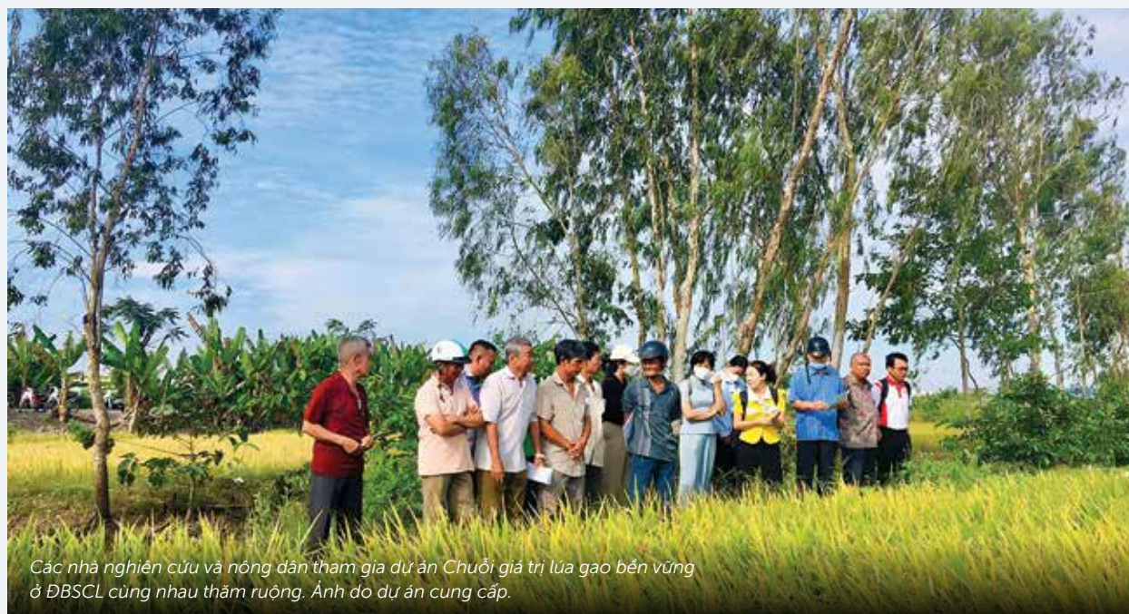
Các nhà nghiên cứu và nông dân tham gia dự án Chuỗi giá trị lúa gạo bền vững ở ĐBSCL cùng nhau thăm ruộng.