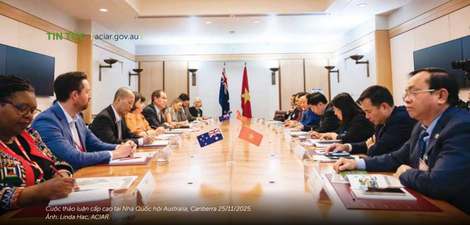
Cuộc thảo luận cấp cao tại Nhà Quốc hội Australia, Canberra 25/11/2025.