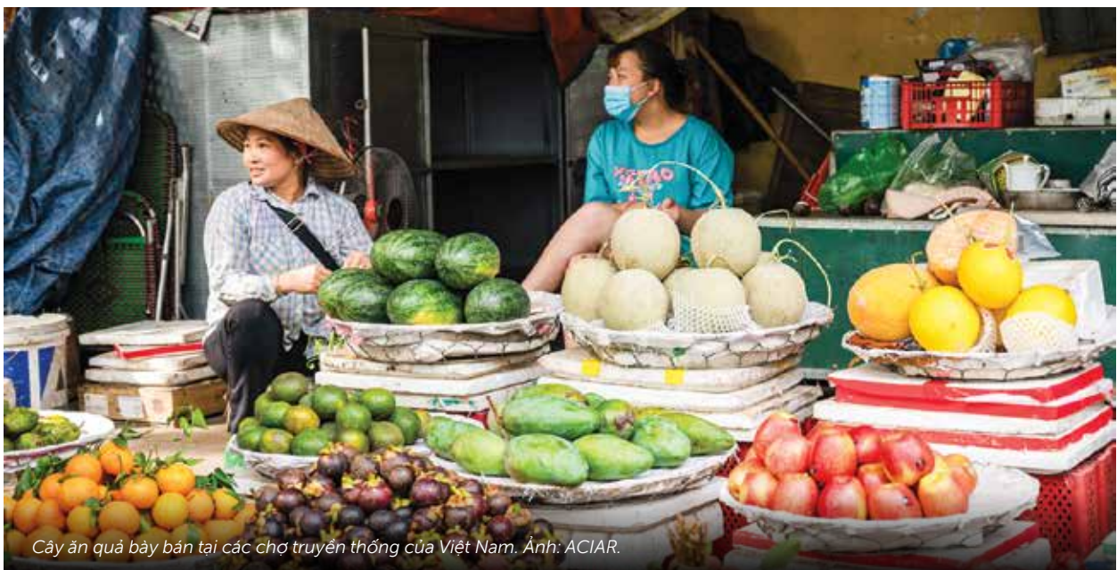
Cây ăn quả bày bán tại các chợ truyền thống của Việt Nam.

Kết quả điều tra của dự án trong năm 2024 cho thấy có khoảng 45.000 ha vườn cây ăn quả trên cả nước đang suy thoái. Trong 5 năm qua, đã có hàng ngàn ha CAQCM bị chặt bỏ, thay thế bằng các cây