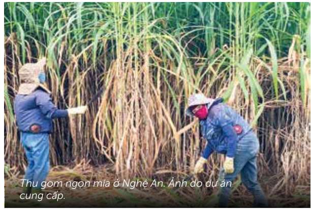
Thu gom ngọn mía ở Nghệ An.