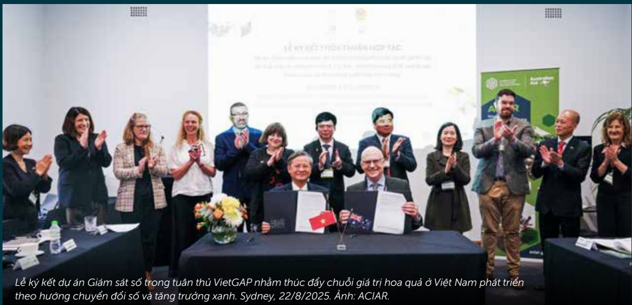
Lễ ký kết dự án Giám sát số trong tuân thủ VietGAP nhằm thúc đẩy chuỗi giá trị hoa quả ở Việt Nam phát triển theo hướng chuyển đổi số và tăng trưởng xanh. Sydney, 22/8/2025.

Đối thoại củng cố cam kết giữa ACIAR và Bộ Nông nghiệp và Môi trường về mối quan hệ hợp tác song phương dựa trên sự tin cậy, chia sẻ trách nhiệm và vì lợi ích chung, như hai bên đã thống nhất trong Thỏa thuận hợp tác ký giữa ACIAR và Bộ Nông nghiệp và Phát triển Nông thôn (trước đây) vào tháng 3 năm 2024.