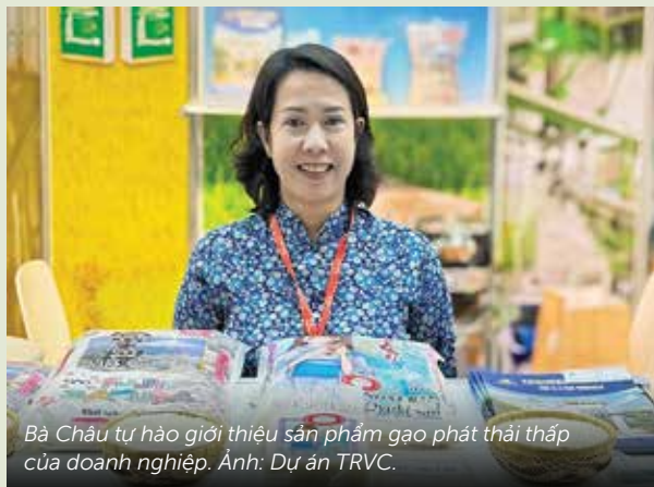
Bà Châu tự hào giới thiệu sản phẩm gạo phát thải thấp của doanh nghiệp.

Đặc biệt, 8 doanh nghiệp đã được trao nhãn hiệu ‘Gạo Việt xanh phát thải thấp’ do Hiệp hội ngành hàng lúa gạo Việt Nam (VIETRISA) cấp—hệ thống chứng chỉ đầu tiên về gạo phát thải thấp của Việt Nam. Trong số đó, công ty Trung An Hi-Tech Farming JSC đã trở thành doanh nghiệp đầu tiên xuất khẩu 500 tấn gạo mang nhãn hiệu gạo phát thải thấp sang Nhật Bản.