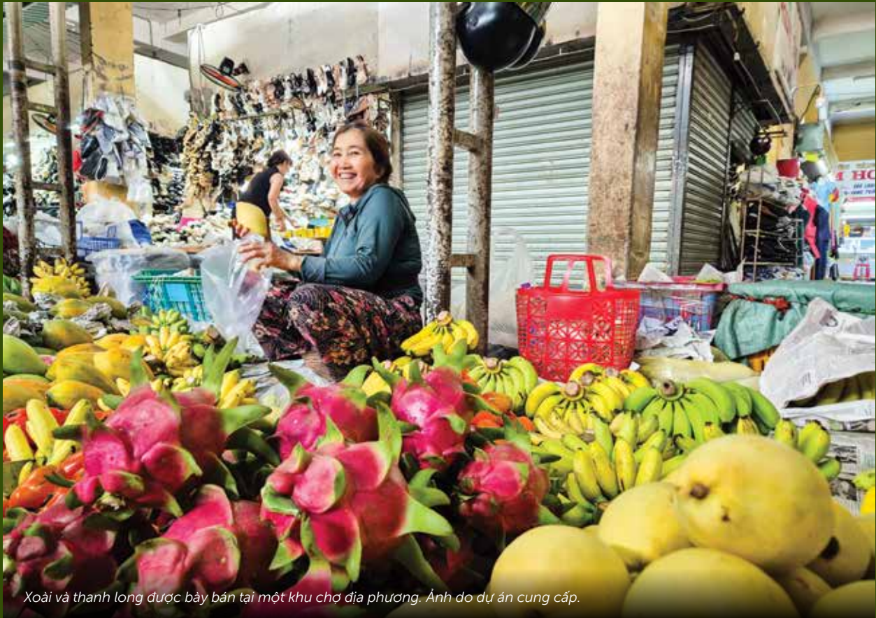
Xoài và thanh long được bày bán tại một khu chợ địa phương.