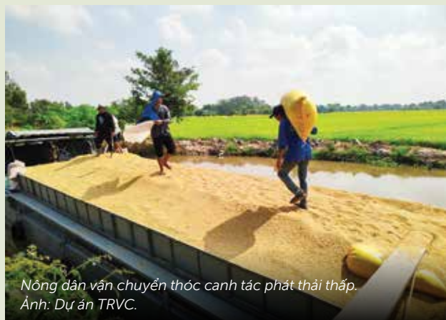
Nông dân vận chuyển thóc canh tác phát thải thấp.

Tính đến tháng 8 năm 2025, nông dân và doanh nghiệp tham gia dự án đã góp phần giảm hơn 129.000 tấn CO2 và đóng góp 34.000 ha diện tích trồng lúa phát thải thấp.