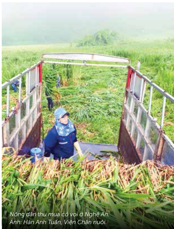
Nông dân thu mua cỏ voi ở Nghệ An.

Công việc của cô là minh chứng cho những điều mà dự án ACIAR tài trợ đang tập trung phát triển. Dự án ‘Liên kết các hoạt động sản xuất của nông hộ vào chuỗi thương mại cung ứng bò thịt tại Việt Nam’ ra đời với mục tiêu hỗ trợ các hộ chăn nuôi gia súc nhỏ tham gia vào các chuỗi cung ứng bình đẳng, hiện đại. Dự án được triển khai với quan hệ đối tác chặt chẽ giữa Đại học Tasmania, Viện Chăn nuôi, Trung tâm Phát triển Nông thôn miền Trung, Học viện Nông nghiệp Việt Nam và công ty Focus Group Go Asia Pacific.