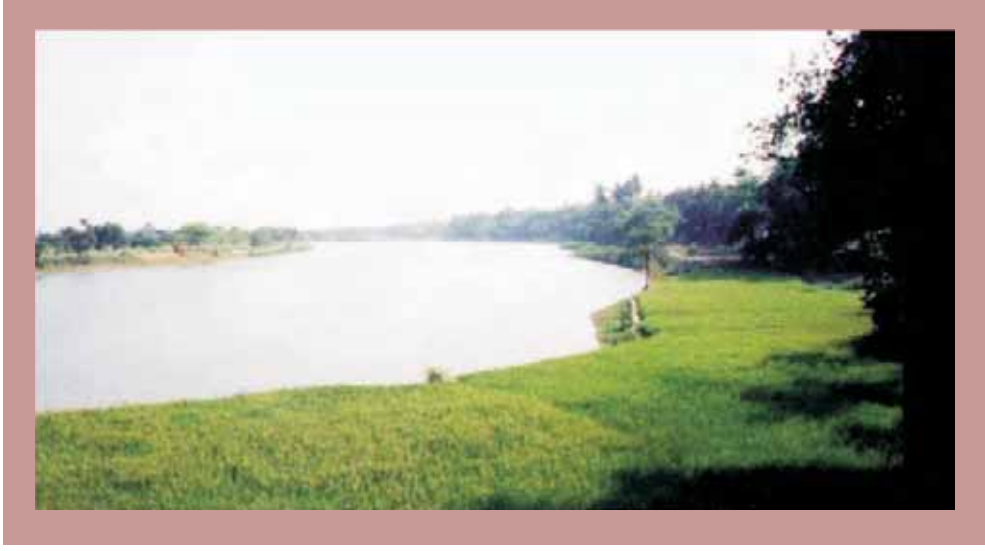
உரு 4. வங்காளதேசத்திலுள்ள ஓக்ஸ்போவ் ஏரியின் உருவப்படம். ஓக்ஸ்போவ் ஏரிகள் அரிதாகவே வறண்டு போவதை அவதானிக்கவும்.